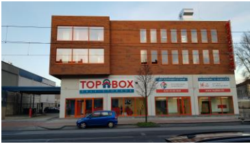
Der Top Box Standort an der Ruhrorter Str. 92